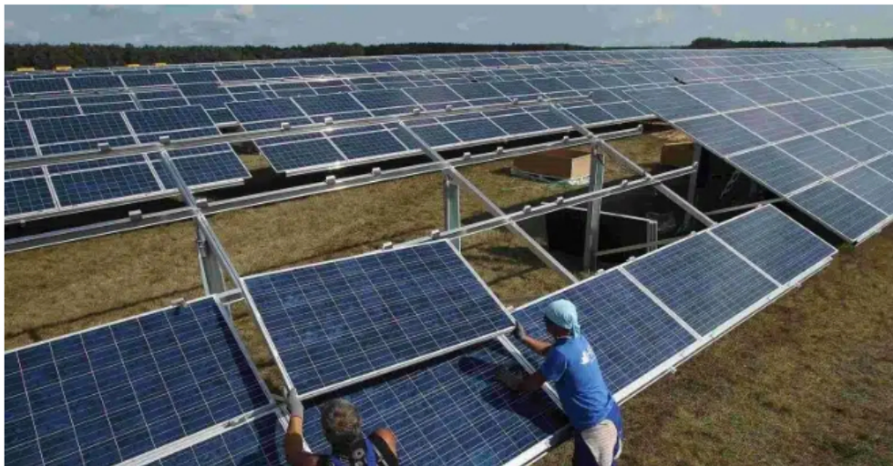
Total Eren construirá y operará parque solar fotovoltaico de Ecopetrol. (Foto referencial)