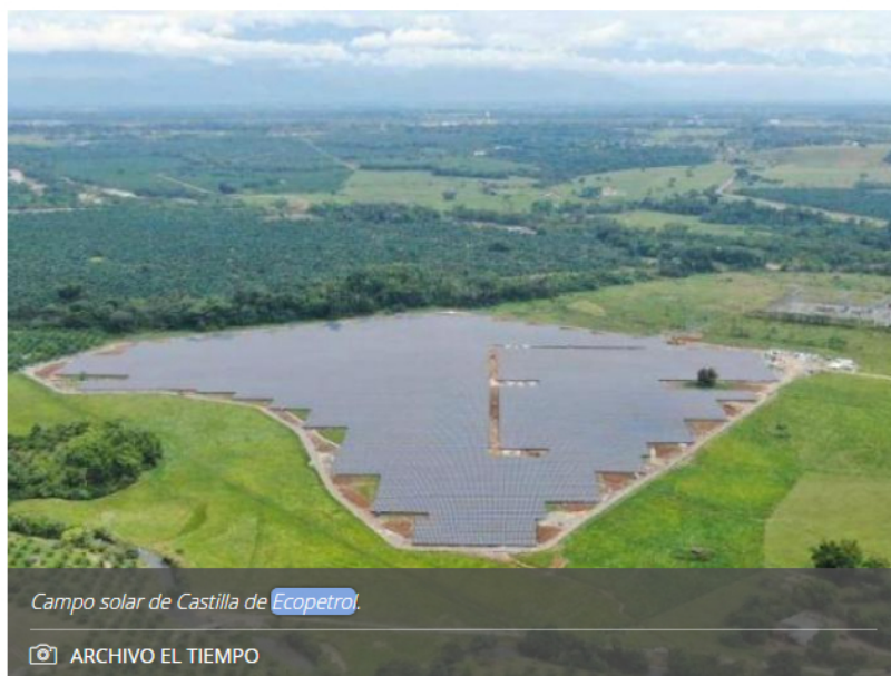
Campo solar de Castilla de Ecopetrol .

Estará en operación en 2024 y contribuirá a la meta de 900 megavatios renovables a 2025 de la petrolera.