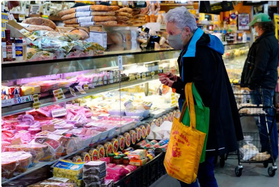
El segundo día de restricciones aliviadas luego de un bloqueo de COVID-19 en Melbourne