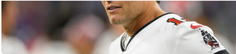
Tom Brady.