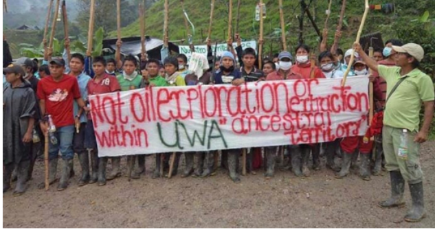
Indígenas U'wa en protestas contra la Occidental

Dos años después, a finales de 2014, Hocol confirmó el hallazgo de gas natural en el pozo Bullerengue Sur-1, ubicado a 30 kilómetros de Barranquilla, cerca de Sabanalarga, en Atlántico, pasado a ser el primero pozo de gas que se operó en ese departamento.