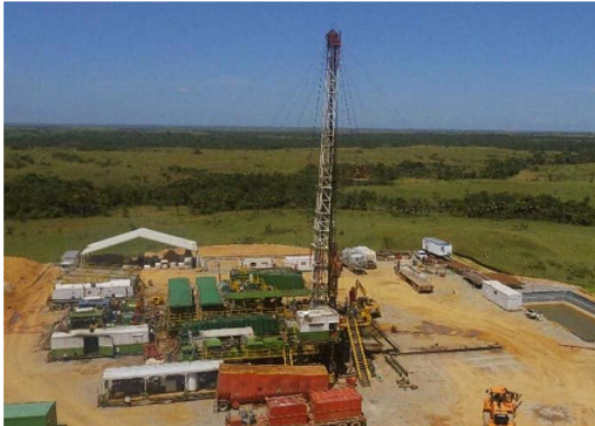
Pozo de Hocol en el departamento de Córdoba

El descubrimiento de gas que realizó Ecopetrol en 2003 fue el mayor descubrimiento realizado solo por la petrolera, ya que por lo general los descubrimientos se realizan en asociación con firmas multinacionales debido a la cantidad de recursos que demanda la exploración. Para iniciar la producción del gas de Gibraltar, Ecopetrol suscribió un contrato con la firma Unión Temporal Gas Gibraltar y la comercialización se firmó un contrato con Gas Natural, empresa que contrató con la compañía TransOriente la construcción del gasoducto que transporta el gas desde el campo Gibraltar hasta Bucaramanga.