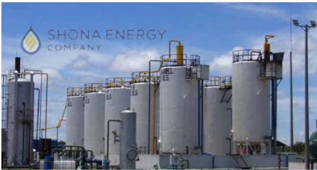
Shona Energy, filial de Geoproduction Oil and Gas se dedica a la extracción de gas

Canacol, con sede en Calgary, se estableció en 1970 y adoptó su actual nombre en 2009. Entró en el negocio del gas en Colombia a través de la adquisición de Shona Energy Company a finales de 2012, que en su momento era una baja producción de gas natural de cuatro campos que producían de yacimientos de arenisca de Ciénaga de Oro en el bloque Esperanza, con ventas exclusivamente a una operación minera cercana.