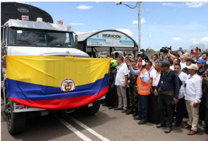
Expectativa por ventas a Venezuela durante el 2023 - Google

Está claro que el 2023 no será el mejor año económicamente para Colombia . Entre las apuestas de cuánto crecerá el Producto Interno Bruto (PIB) una de las más moderadas es la del Banco de la República , que prevé un 0,5 %, lo cual conllevaría a una desaceleración respecto al 8 % que esa entidad vaticinó para 2022. Y ahora se especula con la reapertura total de las fronteras con Venezuela .