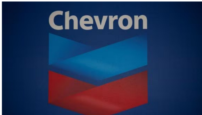
El logotipo de Chevron Global Technology Services Company se ve en una oficina administrativa en Caracas, Venezuela, el 29 de noviembre de 2022.