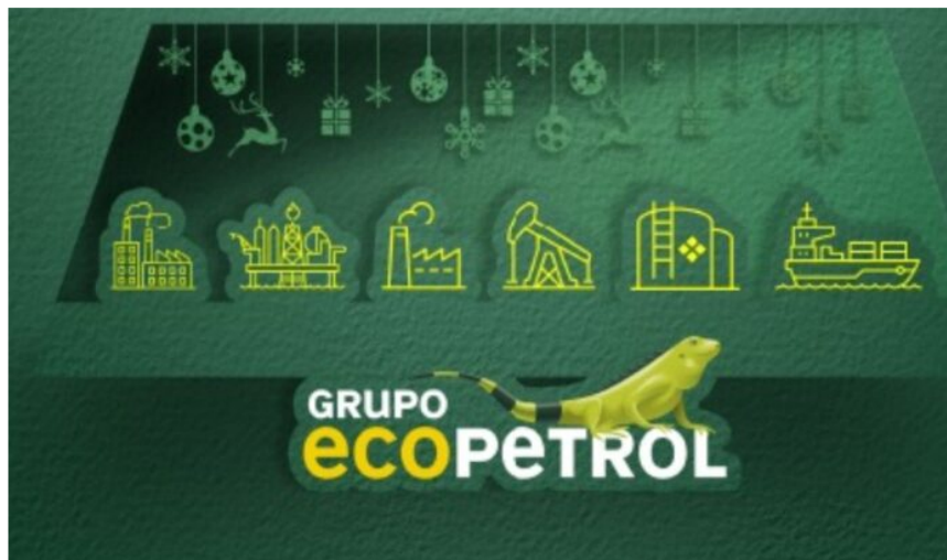
Acción de Ecopetrol arrancó subiendo en este 2023.

Arrancó el 2023 y las acciones en la Bolsa de Valores de Colombia (BVC) comenzaron a subir, pero la de Ecopetrol tiene al MSCIColcap respirando ante un último trimestre de 2022 fatal.