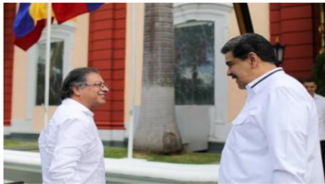
El gobierno de Nicolás Maduro no quiere que el de Petro fomente una relación simultánea de Ecopetrol con PDVSA y Citgo

La empresa petrolero colombiana Ecopetrol gestiona una licencia específica ante la Oficina de Control de Activos Extranjeros del Departamento del Tesoro de los Estados Unidos (OFAC) con la finalidad de poder concretar acuerdos de suministros o asociaciones con Petróleos de Venezuela (PDVSA) en el marco energético que intenta concretar el gobierno de Gustavo Petro con su homólogo Nicolás Maduro.