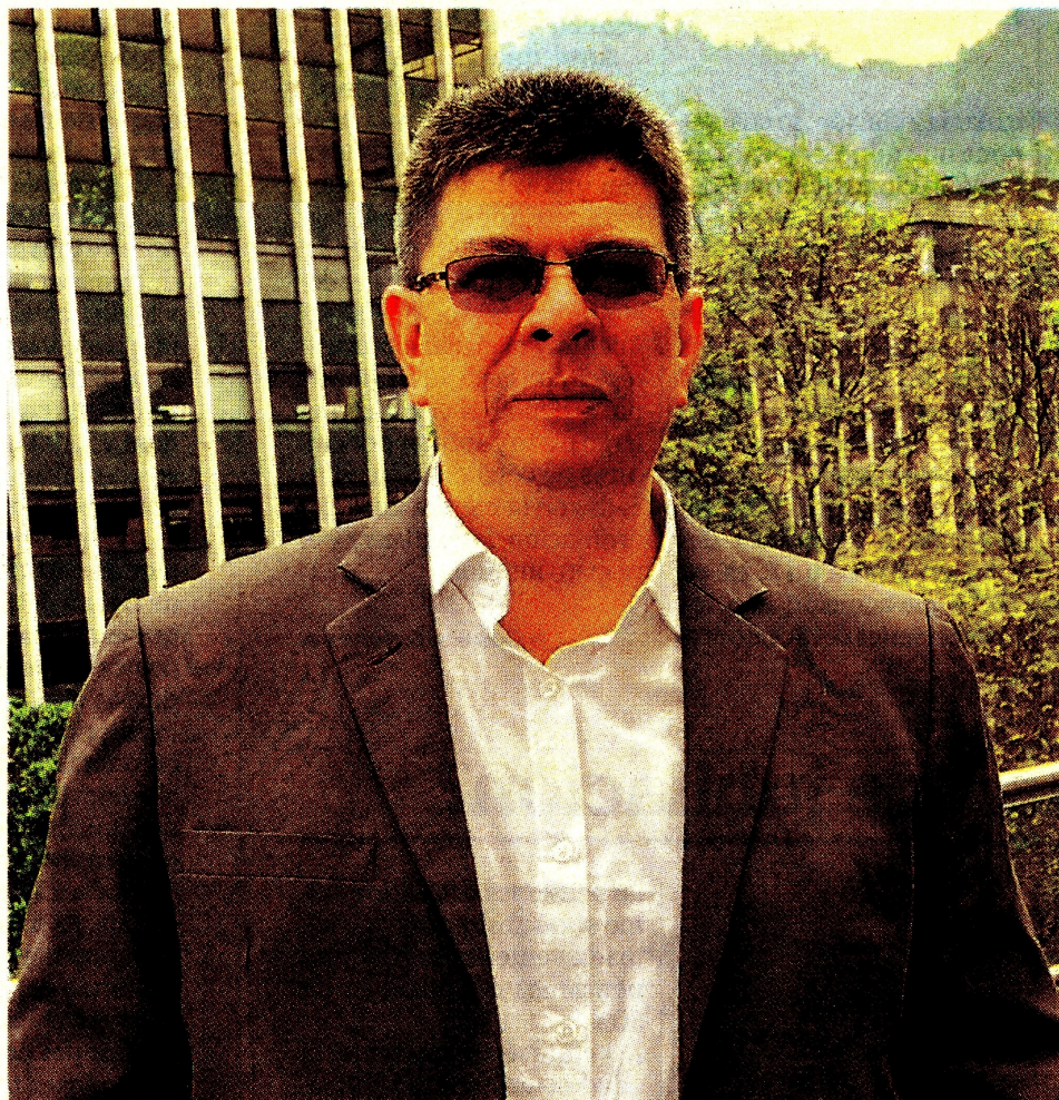
Rodrigo Negrete, director de la Autoridad Nacional de Licencias Ambientales.

Eso nos restringe, porque quisiéramos hacer más. Para 2023 el presupuesto va a tener un recorte, pero estamos priorizando temas asociados a los mecanismos de participación y el seguimiento que nos parece estructural. La mayor conflictividad se presenta en los temas de seguimiento ambiental, no en la evaluación y los hemos identificado especialmente en proyectos lineales. Esto es en las líneas de transmisión eléctrica y vías. El presupuesto sí es muy corto, por lo que estamos buscando la