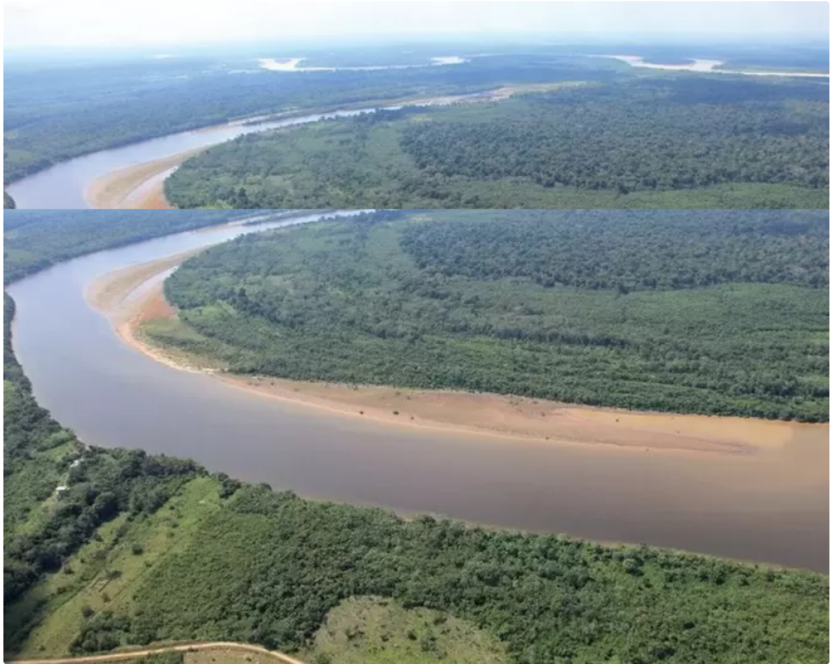
Alcaldía San José del Guaviare

E n el marco de los diálogos sobre las implicaciones que tiene la adopción de un nuevo Marco Mundial para la Biodiversidad , diferentes actores proponen trabajar por la Orinoquía para cumplir las metas en biodiversidad que tiene Colombia.