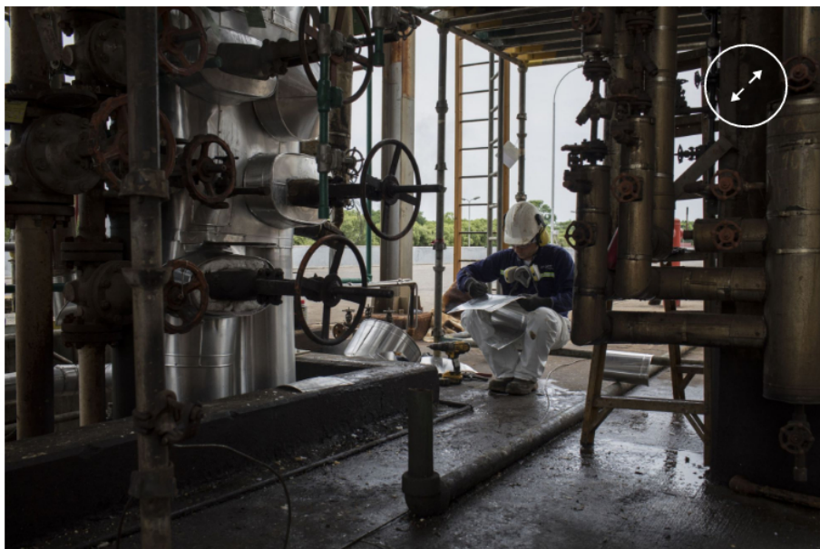
Un empleado trabaja en una refinería de Ecopetrol en Colombia, en 2018.

Los países esperan cosechar mejores resultados esta vez. Ecopetrol , la empresa más grande del país, ha presentado formalmente una solicitud ante la OFAC para recibir una licencia con la que operar con PDVSA , similar a la que ha recibido Chevron, para poder importar gas. La oficina otorgó una autorización a la petrolera estadounidense para reanudar operaciones limitadas de extracción de petróleo en Venezuela después de que el chavismo acordara regresar a los diálogos con la oposición en México, de donde tiene que salir una propuesta de elecciones presidenciales confiables en 2024.