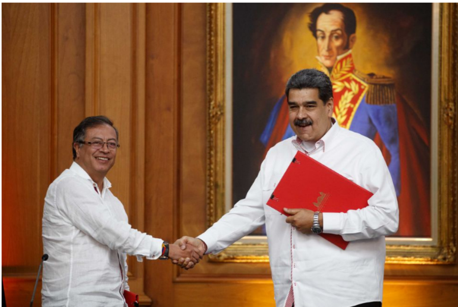
Gustavo Petro y Nicolás Maduro durante una reunión en Caracas, el 1 de noviembre de 2022.

Las relaciones entre Colombia y Venezuela han agarrado