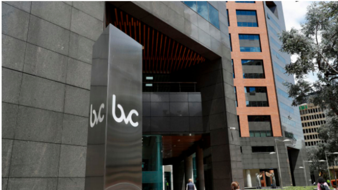
Esta ha sido una semana de fuertes desplomes para la Bolsa de Valores de Colombia.

La Bolsa de Valores de Colombia y Ecopetrol arrancaron con indicadores dispersos este miércoles 4 de enero, luego de los fuertes desplomes reportados el pasado martes, debido al panorama de miedo e incertidumbre que sigue reinando entre los inversionistas, mientras se conocen los datos de inflación acumulada para el año 2022 y las proyecciones de crecimiento económico para el país de cara al primer trimestre de este 2023.