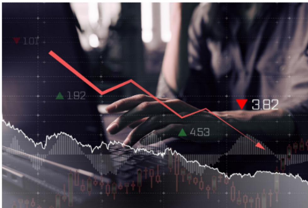
Recesión económica - indicadores

Vale la pena recordar que en la sesión anterior, este indicador (el más importante de la BVC), terminó en 1.269,56 unidades, cayendo de esta forma 1,11 % respecto a las 1.283 que marcaron la referencia. Si bien en las primeras operaciones logró repuntar, igual que hoy, hasta quedar por encima de las 1.290 unidades, desde las 11:00 a. m. mostró signos de debilidad hasta cerrar con uno de los desplomes más fuertes de las últimas semanas, borrando de tajo las pocas ganancias que había logrado en el fin de año.