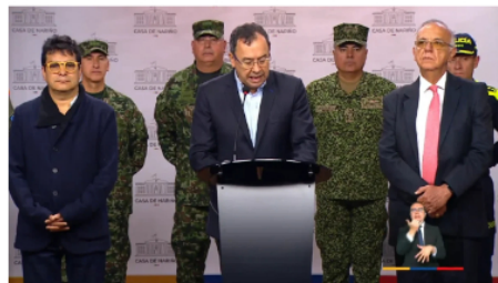
Colombia 4/01/2023 Colombia: En vigencia "Cese al Fuego" bilateral sin el ELN