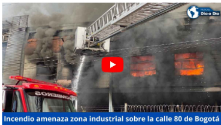
Colombia 4/01/2023 Incendio amenaza zona industrial sobre la calle 80 de Bogotá