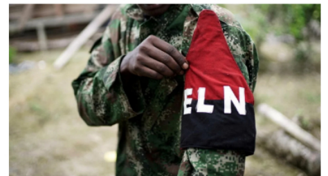
Colombia 3/01/2023 "No hay acuerdo sobre cese al fuego": ELN desmiente al presidente Petro