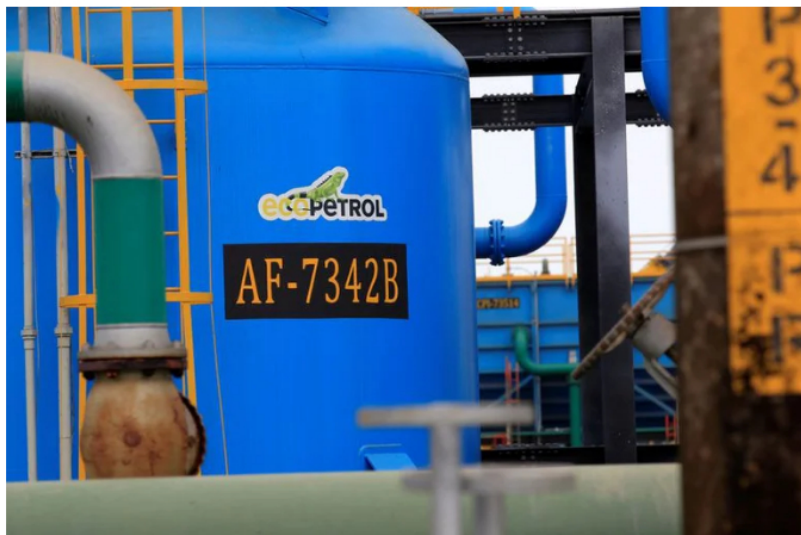
Ecopetrol le apuntará a la transición energética en el 2023.

“El Grupo Ecopetrol , a través de ISA, aseguró que invertirá cerca de $6,3 billones ($19,8 billones para los próximos 3 años), de los cuales $5,4 billones serán para construir 9.657 km de transporte de energía al 2025 (6.227 km de ellos para el transporte de energías renovables no convencionales), con lo que se consolidará a ISA como líder latinoamericana en transmisión de energía”.