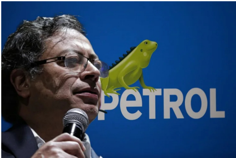
Gobierno nacional dio a conocer la cifra que pretende recaudar de Ecopetrol en el 2023.

El 2023 será el año del inicio de la transición energética para Ecopetrol , si bien es cierto que la principal empresa de Colombia, y que es fundamental para la economía nacional por el manejo que les hace a los hidrocarburos, está focalizada en la preservación y explotación de los hidrocarburos, así como de su exportación; tendrá que empezar a adaptarse a los lineamientos del gobierno de Gustavo Petro , y entre esos, la transición energética es uno de los programas bandera. La compañía ya lo tendría muy claro, a pesar que es un proceso de mediano plazo, este año destinarán billonarios recursos para comenzar el cambio, pero a su vez, tendrán que mantener el impulso, dejándole al país uno 29 billones de pesos transcurridos los 12 meses.