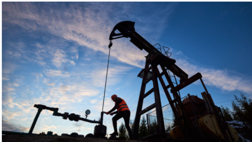
Este fue un año de grandes desafíos para el mercado petrolero.

Los precios internacionales del petróleo terminaron al alza el viernes en la sesión final de un año marcado por la invasión rusa de Ucrania, los temores de recesión mundial y la pandemia de covid-19 en China, lo que provocó fuertes movimientos por varios meses.