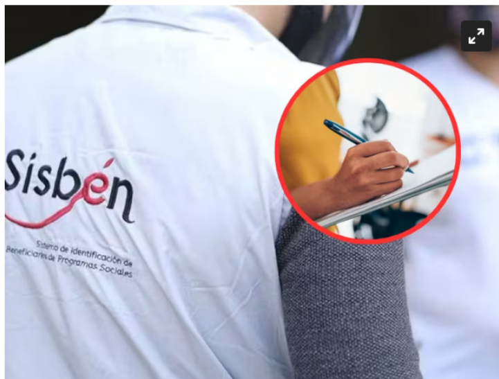
Persona con uniforme del Sisben y de fondo una persona diligenciando un formulario

El gobierno estableció una nueva metodología, en la que se abandona las encuestas para adoptar un enfoque más preciso y detallado