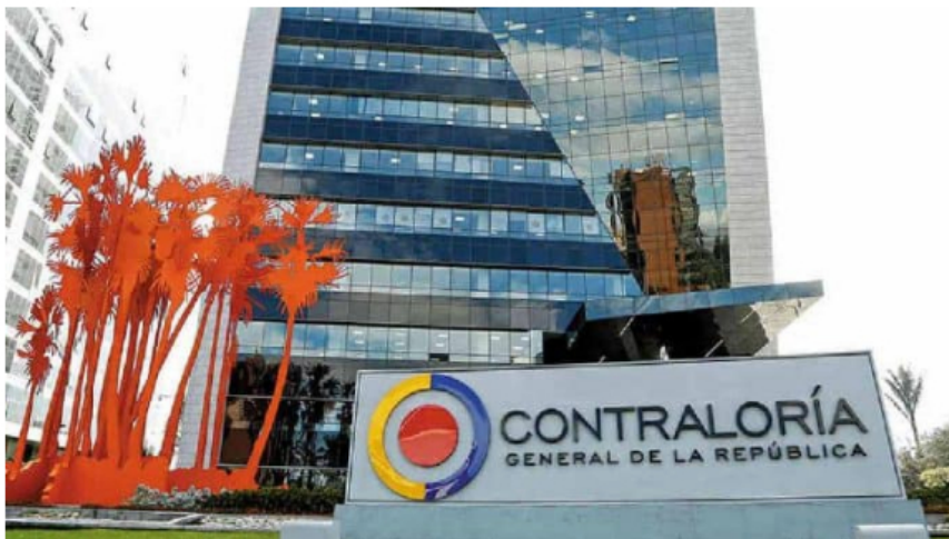
Dejan en firme fallo por obra de pavimentación Incompleta de Ecopetrol en Norte de Santander.