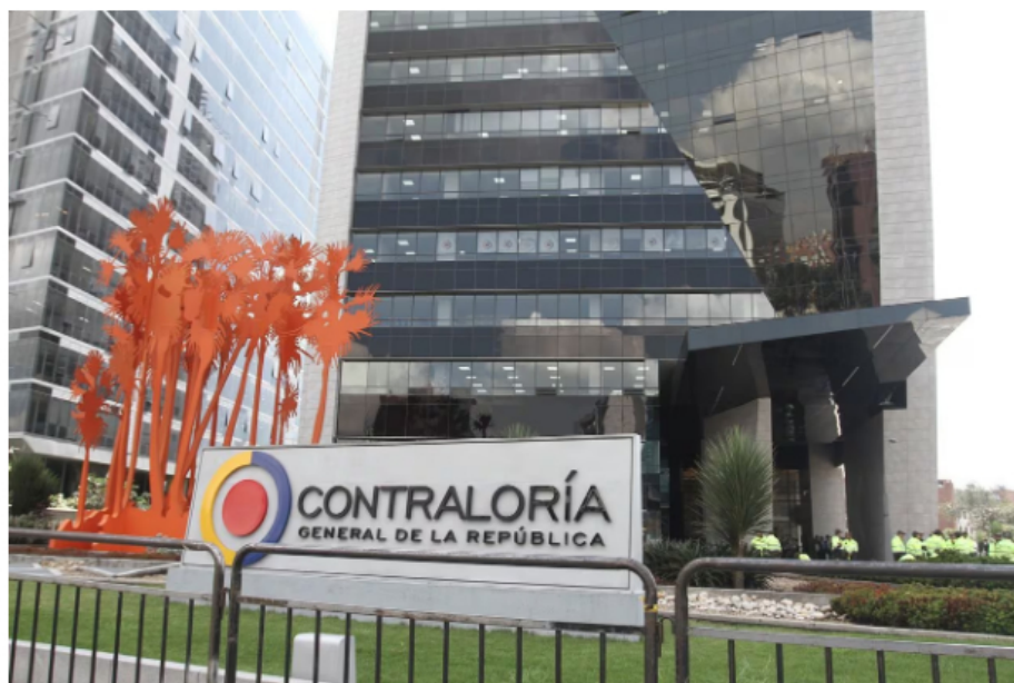
La Contraloría dejó en firme fallo millonario contra Ecopetrol por ejecución "incompleta y deficiente" de obra para pavimentar vía en Tibú.

El contrato en cuestión tenía como objetivo el mejoramiento y la pavimentación de la vía Astilleros-Tibú, abarcando sectores como la vereda La Cuatro, ingreso al casco urbano de Tibú (La Virgen) y la Cuatro-Portería N.º 2 (ingreso a las instalaciones de Ecopetrol Campo Tibú), vía a La Gabarra. Sin embargo, de acuerdo con el ente de control, la obra presenta serios deterioros y no ha sido concluida.