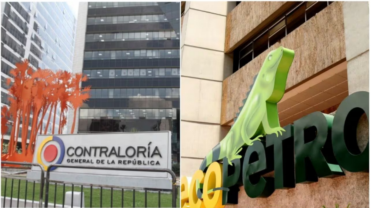
Contraloría deja en firme fallo millonario contra Ecopetrol. (Imagen de referencia)

La Contraloría General de la República ratificó un fallo con responsabilidad fiscal por un monto de $ 20.375 millones, relacionado con la “ejecución incompleta y deficiente” de un contrato de obra suscrito por Ecopetrol para la pavimentación de una vía en Tibú, Norte de Santander, que usa la estatal petrolera.