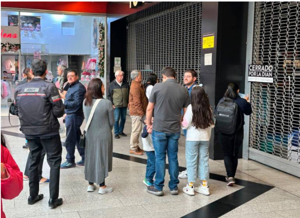
Esta mañana hubo sorpresa entre los clientes de la tienda del Éxito en Unicentro, Bogotá.

La sanción a la organización comercial aplica por tres días.