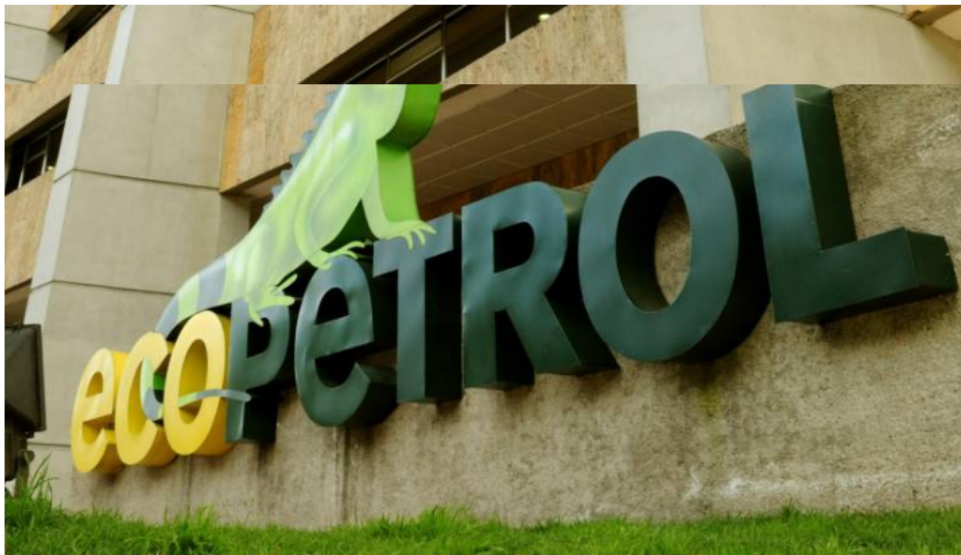
Los hechos se habrían dado entre 2014 y 2017, pero la obra, según la Contraloría, no ha sido terminada y, de lo adelantado, la calidad de la misma presenta defectos constructivos afectando a la comunidad del municipio de Tibú.

El fallo con responsabilidad fiscal contra la petrolera, por $20.375 millones, se da por la ejecución de un contrato para la pavimentación de una vía en Tibú, Norte de Santander. La Contraloría afirma que la obra está “incompleta y deficiente”.