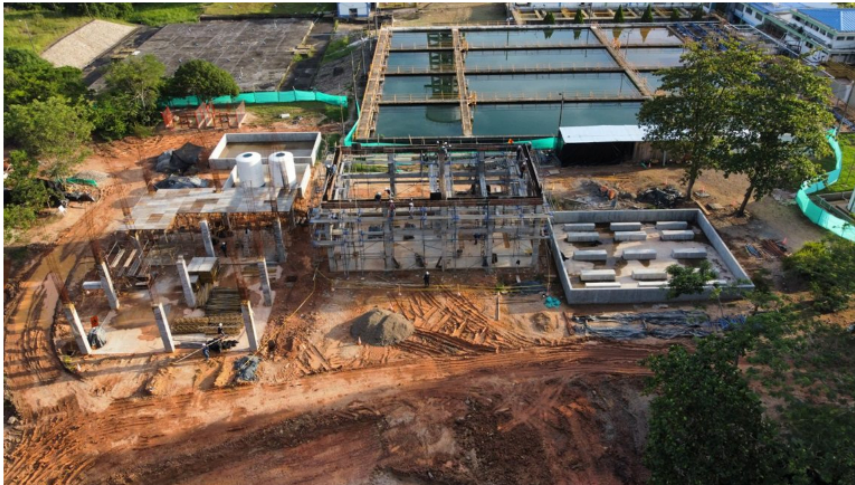
— Así avanza la ejecución de la Planta de Lodos.

Otra obra para proteger el medio ambiente y mejorar la calidad de vida de los barranqueños es la Planta de Tratamiento de Aguas Residuales, PTAR San Silvestre, con la cual se pretende cuidar el agua que se le va a dejar a las actuales y a las nuevas generaciones, porque esta planta recoge todas las aguas negras de la ciudad para limpiarlas.