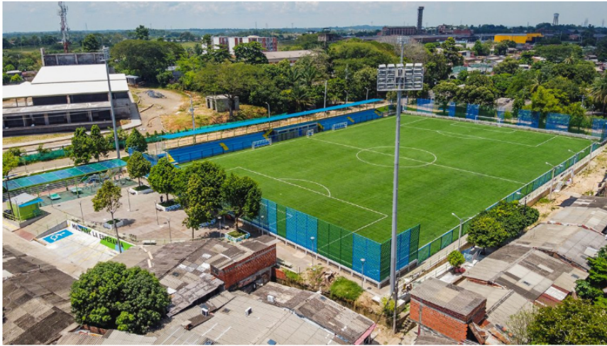
— 36 parques y 55 polideportivas renovados, más de 78 mil metros cuadrados de espacio público de calidad, que incluye la renovación de la Calle Centenario, Calle 49 y mucho más.

Esto le valió el reconocimiento que hace poco hizo el Fondo de la Organización de Naciones Unidas para la Seguridad Vial al hacer mención del proyecto de movilidad implementado por la Alcaldía Distrital de Barrancabermeja con la colaboración de la Comisión Económica para América Latina y el Caribe, Cepal.