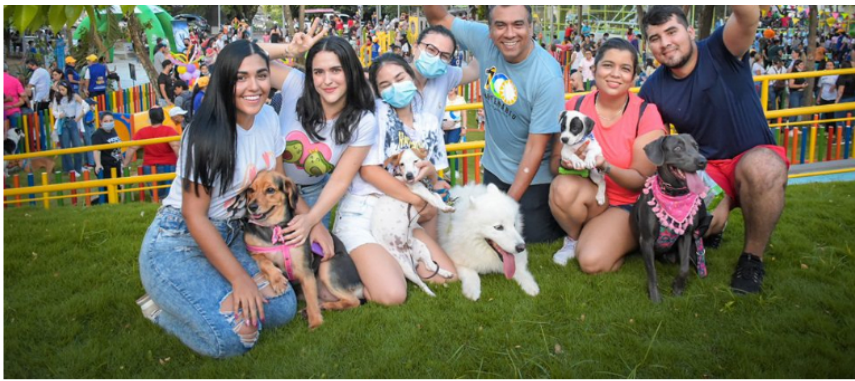
— Se construyó el Multiparque La Esperanza, que hace parte del complejo denominado 'Villa Juventud' junto a la Megaludoteca y la nueva sede de las UTS, en la comuna 5.

El Gobierno del Centenario también está construyendo el Mercado Pesquero “para todas esas mujeres y hombres que admiro mucho porque se la han sudado en La Rampa y El Muelle vendiendo en sus viejas neveras el pescado a 4,0 grados de temperatura, y acomodando yuca y plátano en sus carretas, un espacio que les dará dignidad a estas personas que llevan hasta más de 30 años trabajando en este oficio, y a los compradores de los frutos del río y el campo un sitio limpio y cómodo de abastecimiento para el hogar, restaurantes y negocios de comidas”, resaltó Eljach Manrique.