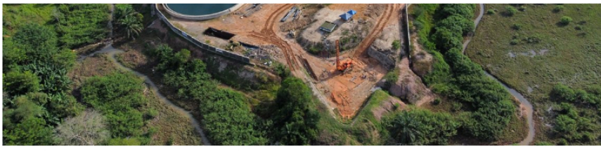
— Así avanza la Planta de Tratamiento de Aguas Residuales.