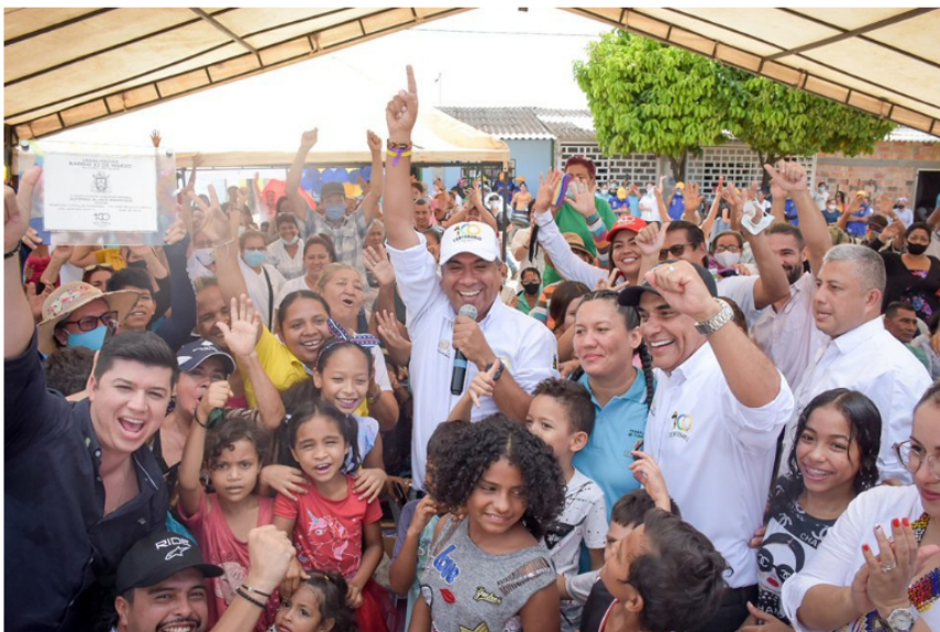
Se instalaron más de 34 kilómetros de redes de alcantarillado nuevo, con lo cual además de reducir el riesgo de inundaciones en varias zonas de la ciudad, se logró prevenir la contaminación de cuerpos de agua cercanos.

El mandatario asegura que “en Barrancabermeja el agua cambió”, recordó que las redes de acueducto tenían más de 50 años de antigüedad y eran de asbesto – cemento deteriorado, entonces fue por eso que sin pensarlo dos veces avanzó en la instalación de más de 61 kilómetros de nueva tubería en PVC a lo largo de toda la ciudad, para que el agua potable llegue a todas las casas.