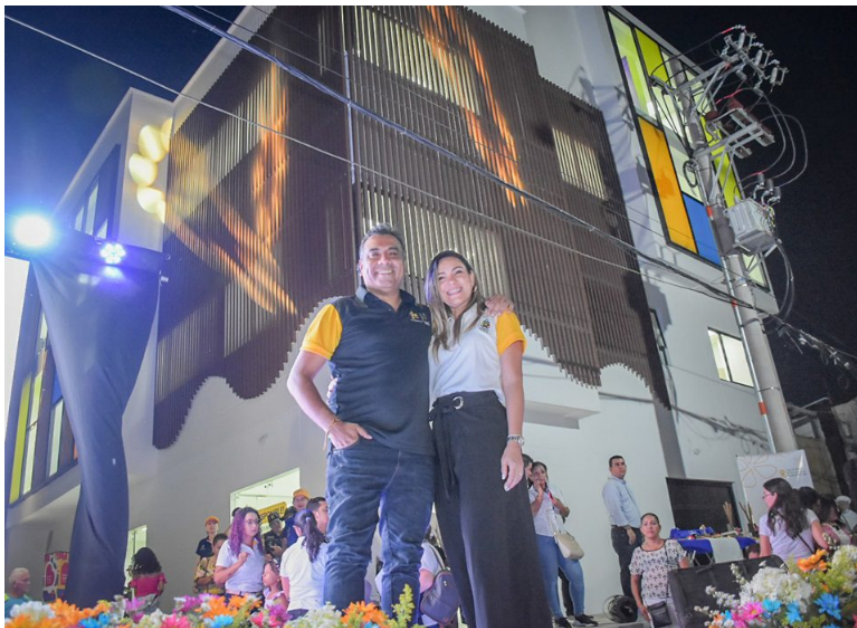
— Casamatriz es símbolo en Colombia, de lo que es romper la inequidad y dar oportunidades efectivas a las mujeres.