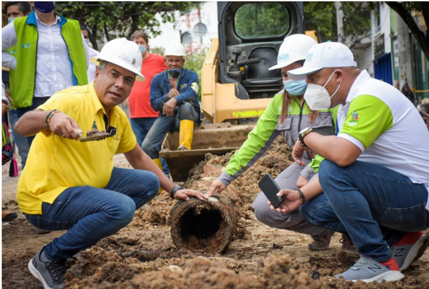
— En el barrio Pablo Acuña, en la comuna 7 (nororiente de Barrancabermeja), se intervinieron 2.530 metros lineales de vías; además se instalaron 1.000 metros lineales de alcantarillado y más de 330 puntos de gas natural

En los barrios el cambio extremo también fue un hecho, por ejemplo en el barrio Pablo Acuña, en la comuna 7 (nororiente de Barrancabermeja), se intervinieron 2.530 metros lineales de vías; además se instalaron 1.000 metros lineales de alcantarillado y más de 330 puntos de gas natural.