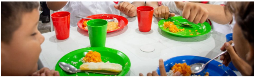
— En construcción el restaurante escolar del Instituto Técnico Superior Industrial, el más grande de Barrancabermeja.

Gracias a este fondo, de ahora en adelante la administración del actual Alcalde Eljach Manrique, y las siguientes, podrán atender rápidamente las necesidades de las instituciones educativas.