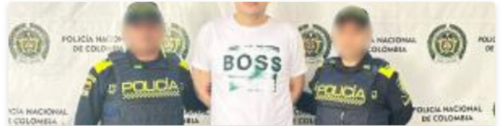
Capturan a presunto abusador sexual que actuaba en el norte de B/quilla