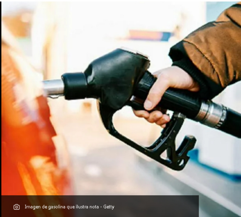
Imagen de gasolina que ilustra nota