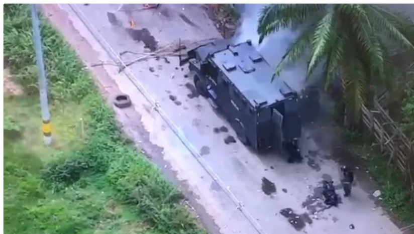
Hostigamiento a policías en Yondó, Antioquia.