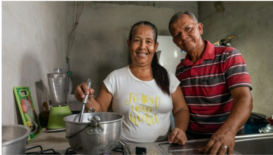
En todo el país, otras 40 mil familias ya disfrutan del gas natural domiciliario, un combustible más limpio, amigable con el medio ambiente y más barato.