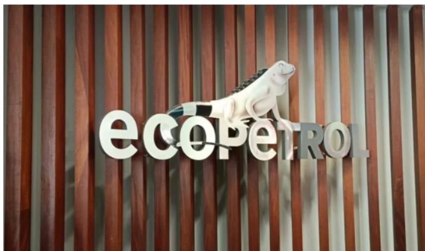
Logo Ecopetrol.