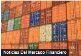
Noticias Del Mercado Financiero

Estados Unidos lideró lista de países desde donde Colombia importó más productos en octubre