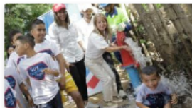
Agua potable, el regalo de Navidad adelantado para los habitantes de Barrigón