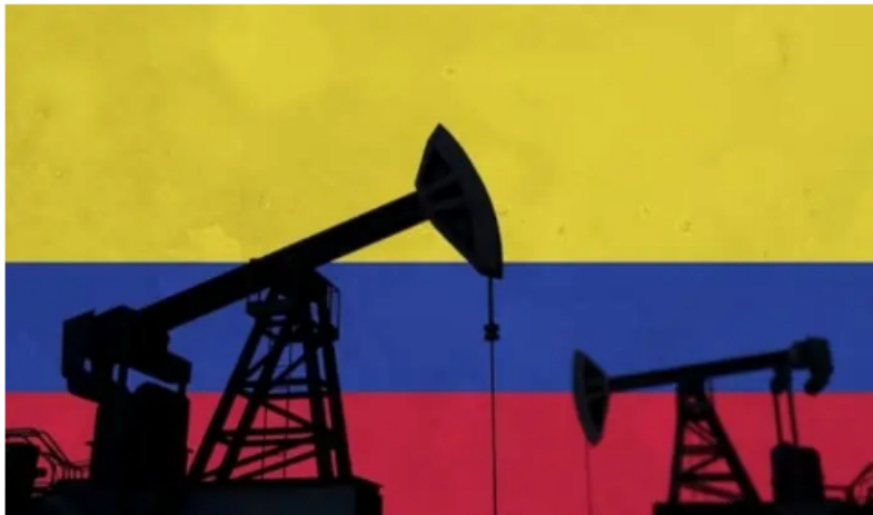
Producción de petróleo en Colombia subió 2,8% en octubre de 2023.