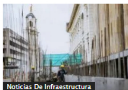
Noticias De Infraestructura