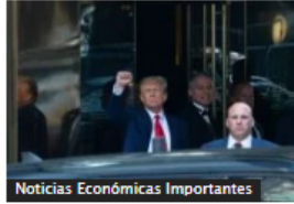
Noticias Económicas Importantes

Conozca los pasos para registrar la matrícula de un vehículo o moto en Bogotá a cierre de 2023