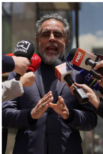
Armando Benedetti, ex embajador en Venezuela