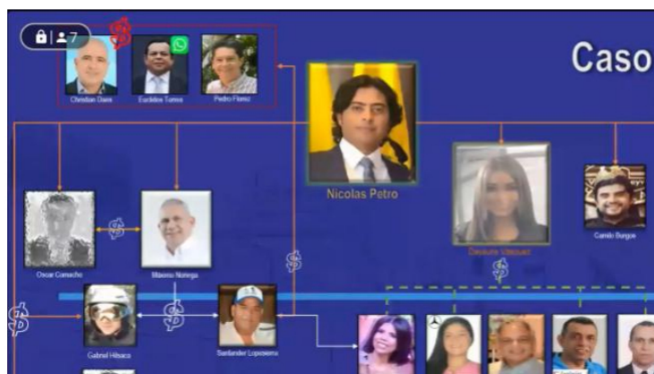
Organigrama de quienes habrían financiado a Nicolás Petro.