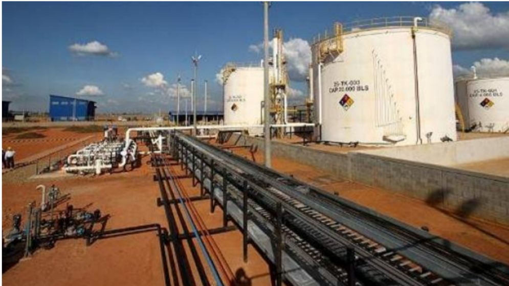
Hocol y Lewis Energy ya están definiendo el plan de pruebas que se ejecutará durante los próximos días para comenzar sus respectivas operaciones.

EL TIEMPO estableció que tras el sobrevuelo y el anuncio del potencial gasífero, en una filial de Ecopetrol se empezó a mover el tema de Sinú 9. Cuando EL TIEMPO indagó sobre el tema, en Ecopetrol informaron de manera oficial que a la fecha "no se ha firmado acuerdo operativo, memorando de entendimiento o carta de intención de asociación con el proyecto Sinú 9 durante 2023".