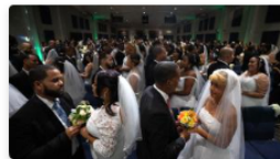
Boda multitudinaria: 78 parejas se casan el tiempo en República Dominicana