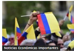
Noticias Económicas Importantes Cae la percepción positiva sobre el futuro de Colombia: Invamer