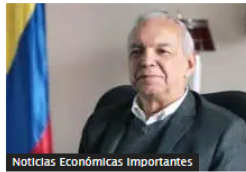
Noticias Económicas Importantes Colombia colocó cerca de $1 billón en TES verdes con tasas del 10 %