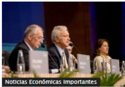
Noticias Económicas Importantes Avanza negocio final por Nutresa: novedades sobre OPA tras escisión e intercambio accionario