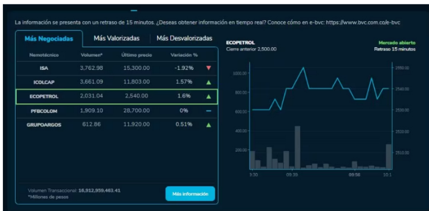
Así amanecieron las acciones de las empresas en la BVC durante este 14 de Diciembre.

En los últimos dos años está la acción de Ecopetrol, con un volumen de 2.416,11 y la acción de Grupo Argos, con un volumen de 756.00.