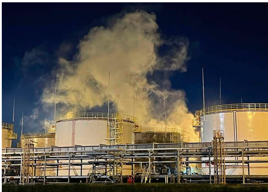
En esta foto del folleto publicada por el gobernador de Krasnodar, Veniamin Kondratyev, en su canal de Telegram el jueves 4 de mayo de 2023, el humo se eleva desde el costado del complejo de fabricación de la refinería de petróleo Ilsky en la región de Krasnodar, en el sur de Rusia.

Por su parte, la referencia Brent, que es una de las más transadas en el país, registra un crecimiento del 3,37 % y se ubica en un precio de 76,76 dólares.