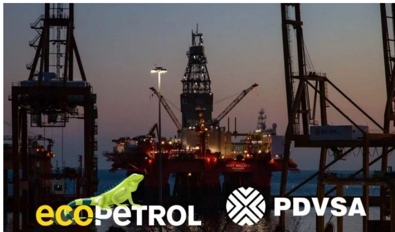
Acuerdo entre Ecopetrol y PDVSA pretende restablecer relaciones con Venezuela: MinMinas.

Síguenos en nuestro canal de noticias de WhatsApp