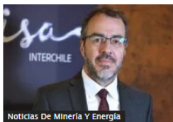
Noticias De Minería Y Energía