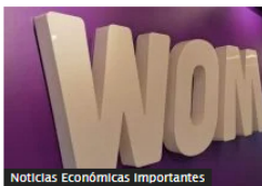
Noticias Económicas Importantes

¿Por qué el gobierno Petro esperará hasta el 2024 para buscar aprobar la reforma pensional en Colombia?