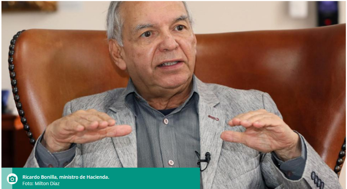
Ricardo Bonilla, ministro de Hacienda.