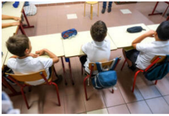
III Uniforme escolar: cómo toma forma el experimento