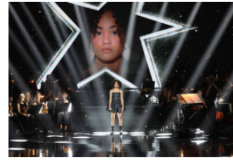
III "Soft TV" nos engatusa relanzando los programas emblemáticos de la década de 2000