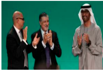
COP28: tras el acuerdo de Dubai, las respuestas de nuestros periodistas a sus preguntas