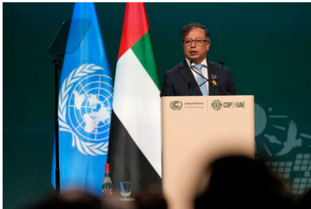
El presidente colombiano Gustavo Petro durante una sesión plenaria de la 28ª conferencia mundial sobre el clima, en Dubai (Emiratos Árabes Unidos), el 1 de diciembre de 2023.

Con motivo de la 28ª Conferencia de las Partes sobre el Clima (COP28) en Dubai, diez pequeños estados insulares y Colombia se comprometieron a impulsar un tratado sobre la no proliferación de combustibles fósiles. Un centenar de ciudades y miles de organizaciones medioambientales apoyan la iniciativa. Colombia, que duplica el tamaño de Francia, con 50 millones de habitantes, produce unos 800.000 barriles de crudo al día y 85 millones de toneladas de carbón al año, figura como un gigante en esta coalición en la que se encuentran Estados como Samoa, Palau, Fiji, Antigua y Barbuda y Timor Oriental.