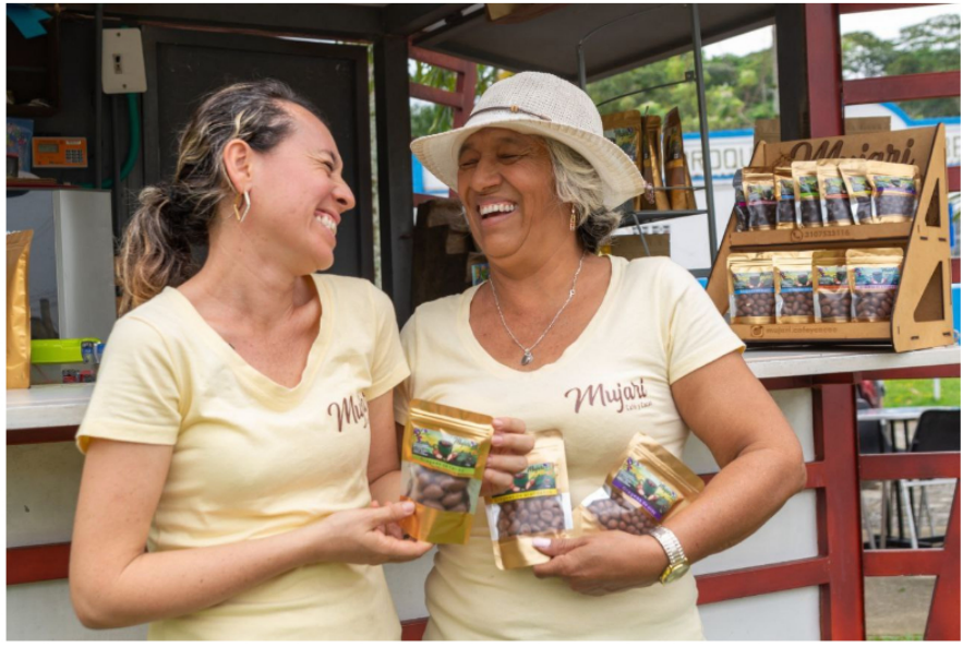
Inicio / Última hora / Con el apoyo de Ecopetrol cinco asociaciones productoras de chocolate y café del Meta comercializan sus productos en Expoartesánias 2023