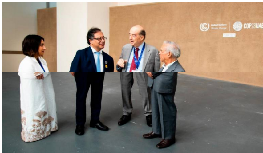
El Jefe de Estado estuvo acompañado por sus grandes escuderos, entre ellos, el canciller, el ministro de Hacienda y la ahora directora del DPS Laura Sarabia.

El mandatario multiplicó por 13 el número de invitados que estuvieron en la COP del año pasado.