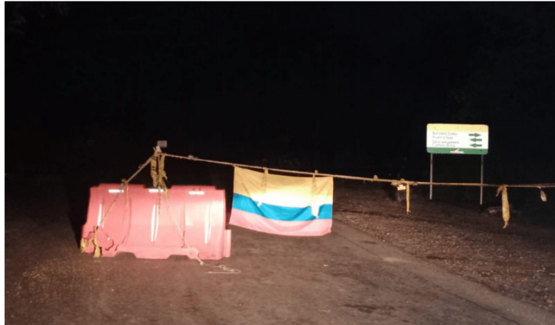
El bloqueo, que persiste desde hace 14 días, no solo afecta las operaciones de la compañía sino que también amenaza el entorno natural.

directa el trabajo de cerca de 30 personas.