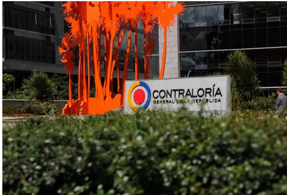
Contraloría General de la República