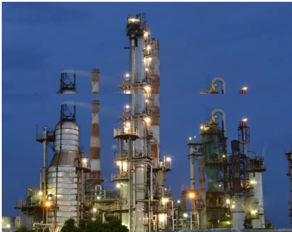
Refinería Ecopetrol Barrancabermeja