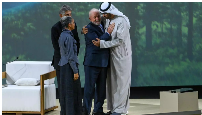
El presidente de Brasil, Luiz Lula Da Silva, junto a su ministra de Medio Ambiente, Marina Silva, y el titular de la COP28 el Sultan Al Jaber. COP28