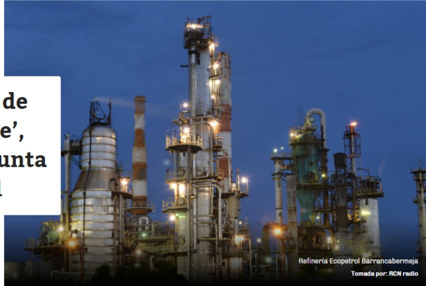
Refinería Ecopetrol Barrancabermeja