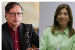
"Tengo mi distanciamiento": presidente Petro sobre renuncia de Martha Lucía Zamora

"Denuncié frente al tema del lote 6, de 22 hectáreas, que es el único inmueble de la empresa, que el agente liquidador nos había dado un precio del metro cuadrado y que estaba haciendo gestiones para su venta para cubrir las obligaciones del tema pensional y prestacional. De un momento a otro, cuando él regresó a la Asamblea nos dijo que el valor del metro cuadrado había decrecido en un 70 %", advirtió.