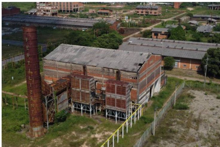
Antigua planta de operaciones de Fertilizantes Colombianos, Ferticol, en Barrancabermeja.

Desde la Asamblea del Departamento, varios diputados reaccionaron al informe de la Unidad Investigativa de Vanguardia en el que se revelan presuntas irregularidades en la liquidación de la empresa de capital público.