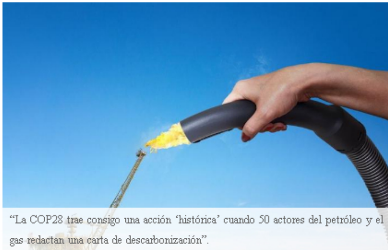
“La COP28 trae consigo una acción ‘histórica’ cuando 50 actores del petróleo y el gas redactan una carta de descarbonización”.

Ahora que la COP28 está en pleno apogeo, muchos esperan impulsar aún más la acción climática logrando acuerdos que