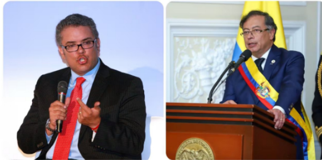
El expresidente Iván Duque lanzó fuertes críticas al proceso de 'Paz total' del gobierno de Petro.

En ese sentido, Duque enfatizó en tono sarcástico que en lo que va de este año, se han presentado 90 masacres, las cuales fueron generadas por los mismos narco-terroristas que quieren beneficiarse con la "Paz Total". "Otra actitud torpe e ideológica que elude responsabilidades", concluyó.