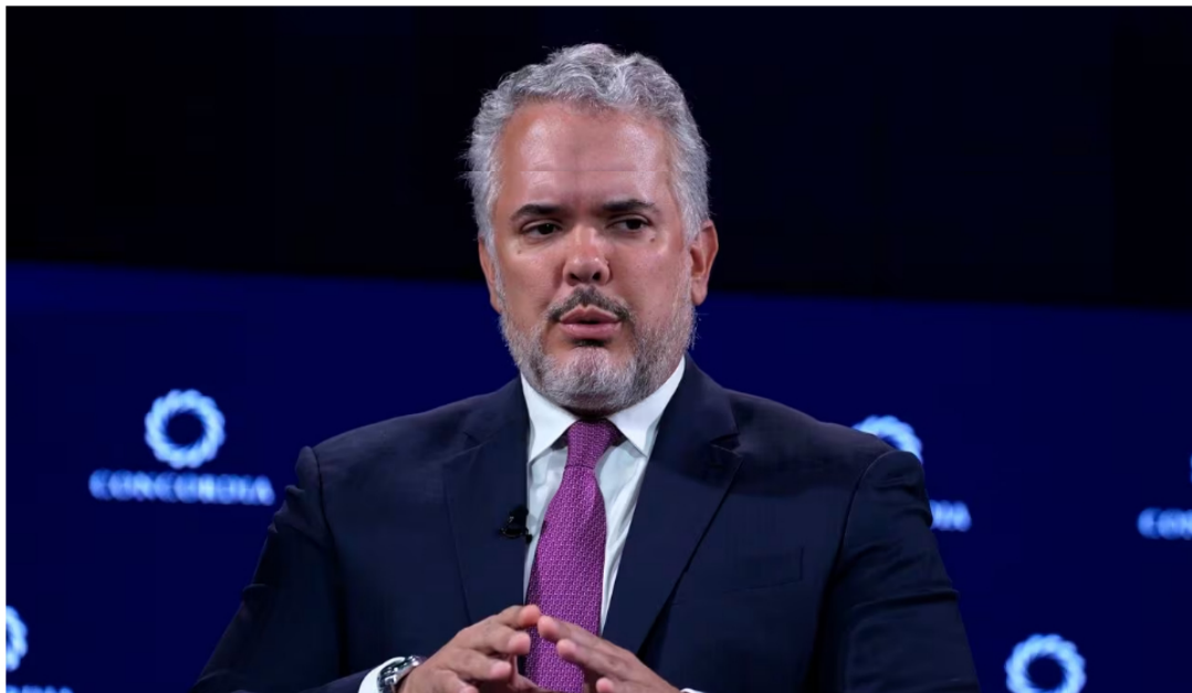
Iván Duque arremetió en su cuenta de X contra el gobierno de Petro y su proceso de 'Paz Total'.

4 de diciembre de 2023 Por: Redacción El País