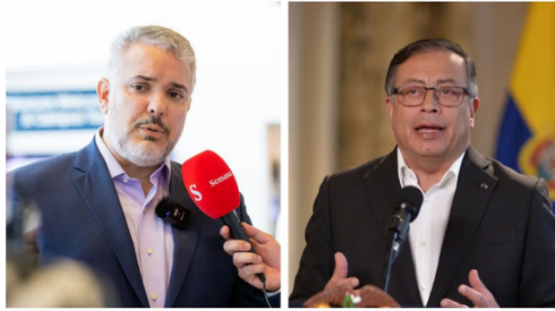
El expresidente Iván Duque ha tenido una fuerte oposición contra el gobierno de Petro.

"Unir a Ecopetrol con una empresa capturada y corrompida por la dictadura de Maduro solo destruirá valor en Colombia, además de ser el vehículo para crear la dependencia energética con Venezuela que anunciaron hace meses" , añadió.