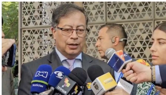
Gustavo Petro resaltó que "Colombia tiene el mismo número de víctimas que el año pasado".

"Colombia tiene el mismo número de víctimas que el año pasado", resaltó el mandatario colombiano, haciendo referencia al gobierno del expresidente Iván Duque.