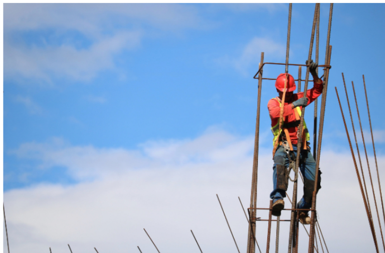
Ante las elevadas tasas de interés, uno de los sectores más afectados es el de la construcción.

El último reporte trimestral dejó en evidencia un proceso de decrecimiento. Se hace indispensable una mayor actividad que plasme en acciones concretas la propuesta de agroindustrialización y la prometida reindustrialización