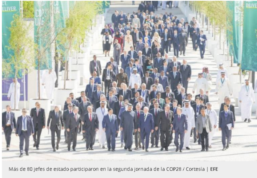
Más de 80 jefes de estado participaron en la segunda jornada de la COP28

Perderían la mitad de sus ingresos 28 petroestados para 2040; México Rusia y Colombia, los más afectados