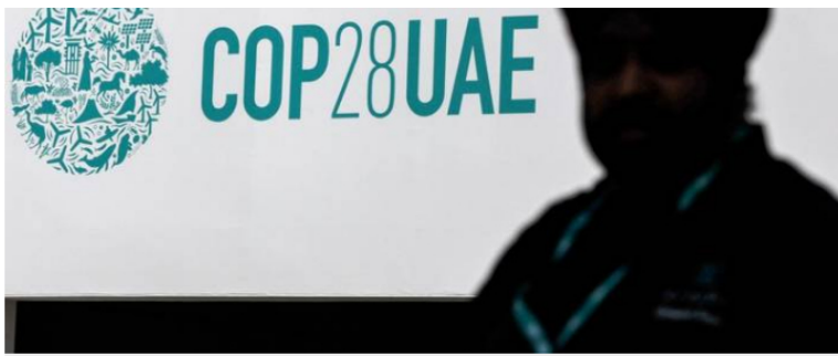
Cumbre COP28.

Por ello la organización, que cuenta con especialistas que se especializan en el riesgo climático en mercados financieros, advierte de que, en muchos países productores, esto dejará "un importante agujero en las finanzas públicas, limitando su capacidad para prestar servicios públicos y amenazando la estabilidad".