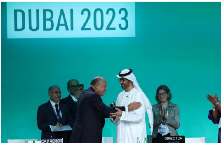
Sameh Shoukry (izq.), presidente de la cumbre climática COP27 y el ministro de Asuntos Exteriores egipcio, y Dr. Sultan Ahmed Al Jaber (der.), presidente designado de la COP28.

Al menos seis estados africanos son muy vulnerables, con más del 60 % de su presupuesto total en peligro: Nigeria, con 215 millones de habitantes, Angola, Chad, Congo, Guinea Ecuatorial y Gabón.