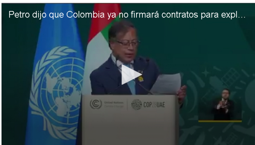
Petro dijo que Colombia ya no firmará contratos para expl...

En su discurso en la COP28, el presidente compartió la postura del país frente a la crisis climática y destacó la suspensión del subsidio a la gasolina