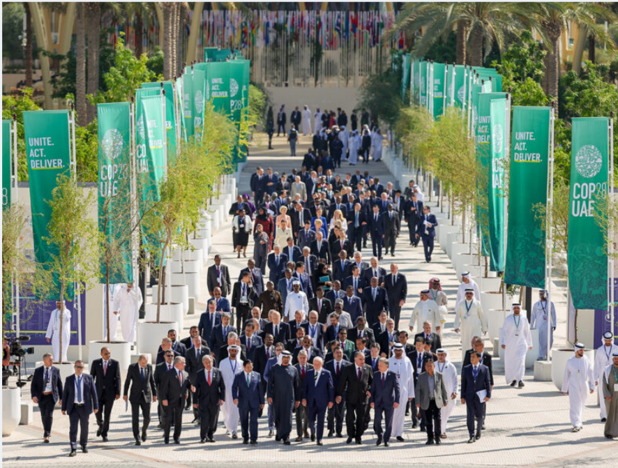
Jefes de Estado mundiales caminan por la avenida Al Wasl después de su foto grupal durante la Conferencia de las Naciones Unidas sobre el Cambio Climático COP28.